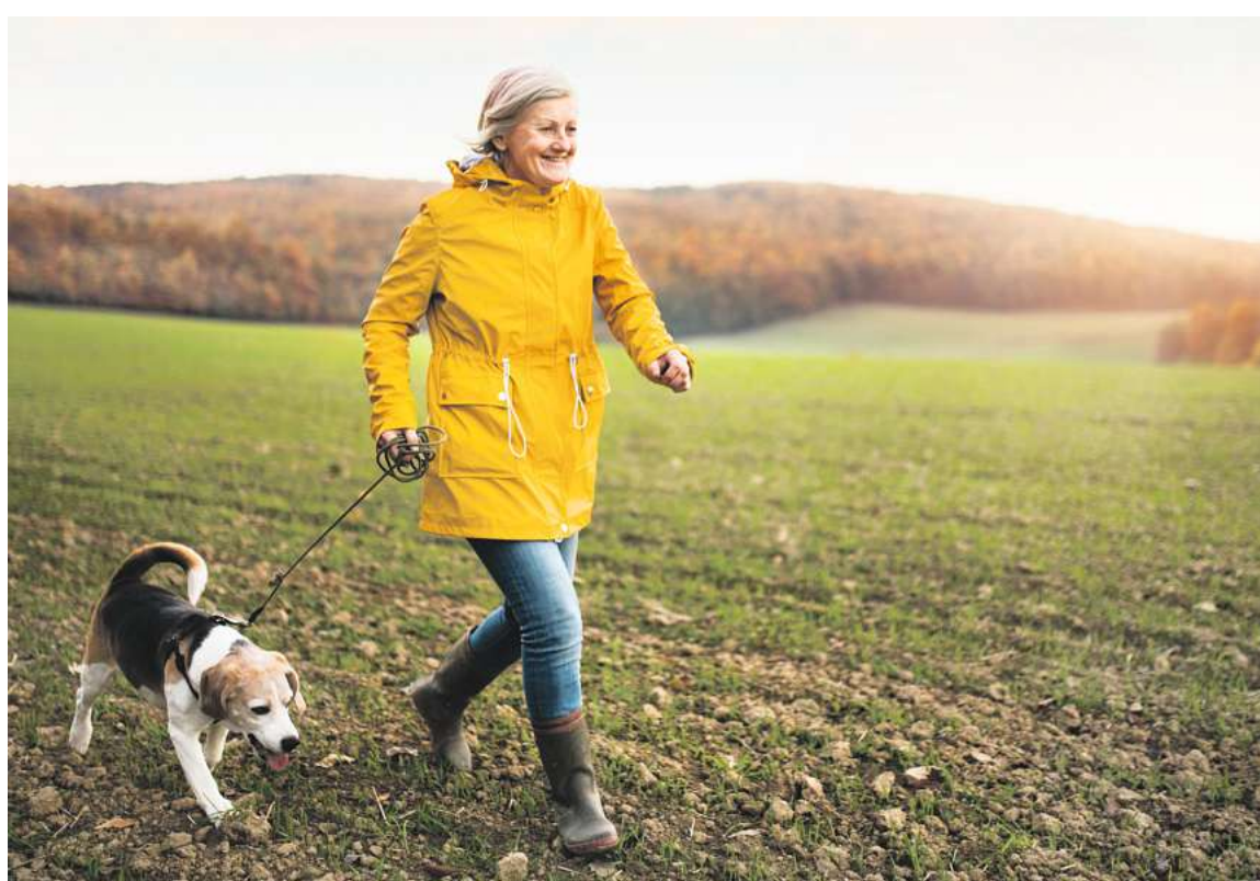
Weniger Darmbeschwerden, mehr Lebensqualität: Was wirksam bei einem gereizten Darm helfen kann

Wiederkehrende Darmbeschwerden waren lange ein echtes Mysterium. Heute sind immer mehr Wissenschaftler der Meinung, dass die typischen Beschwerden durch eine geschädigte Darmbarriere hervorgerufen werden. Vor allem