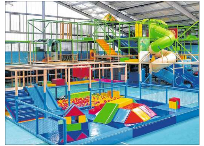
Splash Indoor Spielplatz

An diesem Tag ist für alle Besucher der Eintritt frei - als Hinweis für den Gast allerdings wichtig, dass es aufgrund der großen Besuchermengen zu